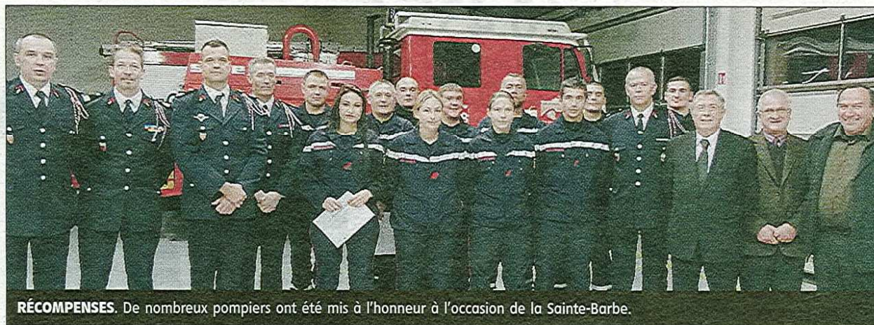
RÉCOMPENSES. De nombreux pompiers ont été mis à l'honneur à l'occasion de la Sainte-Barbe.