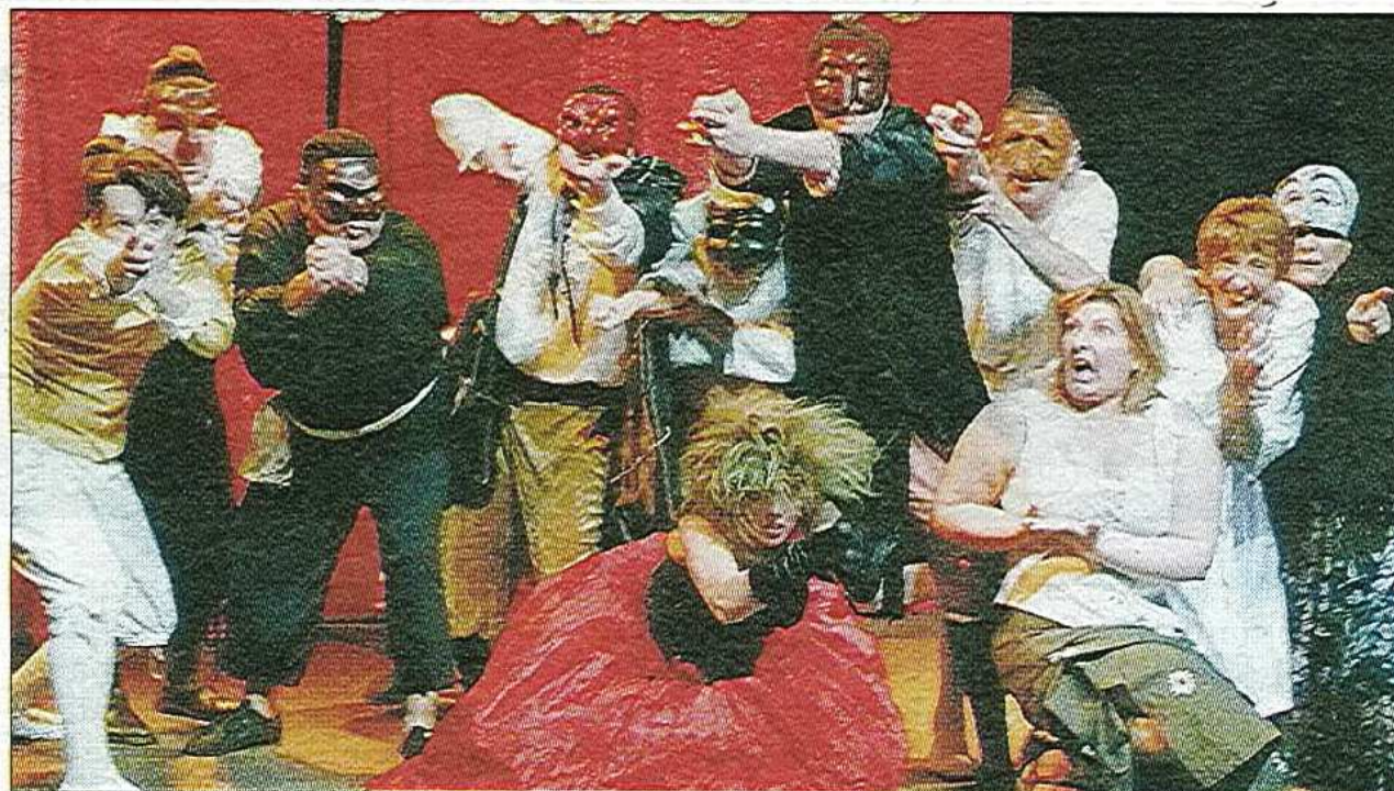
COMMEDIA DELL'ARTE. Les comédiens du Crad ont pris du plaisir et en ont beaucoup donné aussi.

Ce fut une belle performance d'acteurs qui ont pris, eux aussi, beaucoup de plaisir, à se lancer dans de belles improvisations.