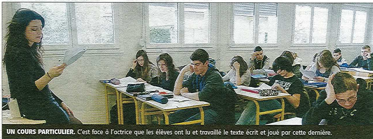
UN COURS PARTICULIER. C'est face à l'actrice que les élèves ont lu et travaillé le texte écrit et joué par cette dernière.