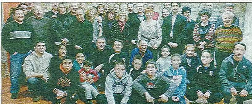
LE RENOUVEAU. Les licenciés et leur famille ont passé un bon moment ensemble pour fêter la nouvelle saison.