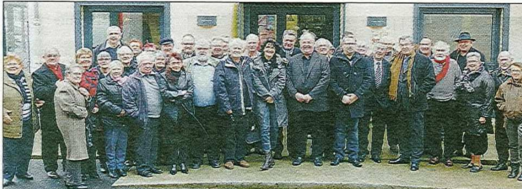
CLUB JEAN JAURÈS. Adhérents et sympathisants se sont retrouvés autour d'une bonne table.

Le club Jean Jaurès du canton de Vic-le-Comte a tenu sa première manifestation de l'année. Toujours aussi conviviale.