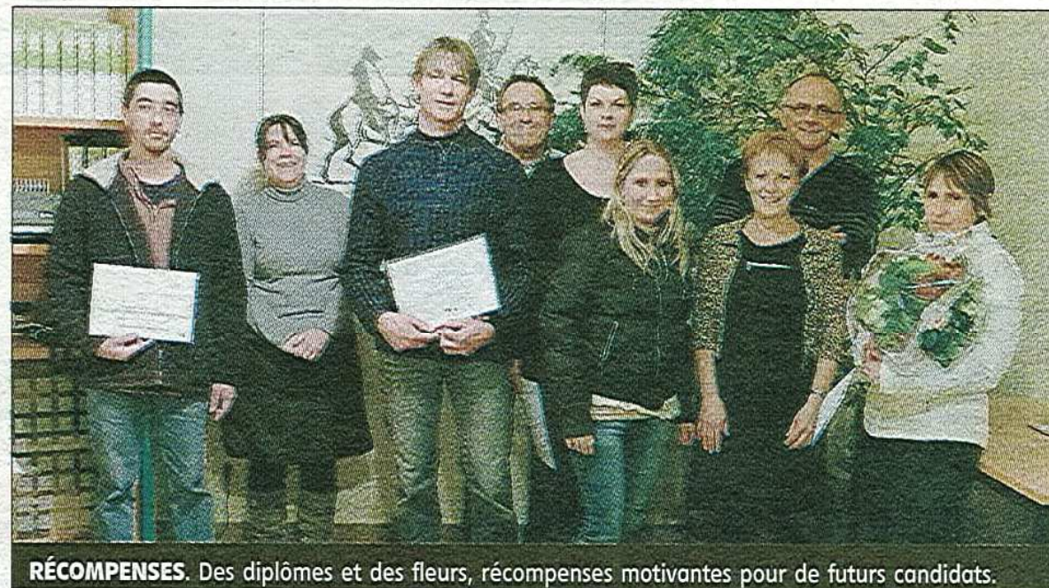
RÉCOMPENSES. Des diplômes et des fleurs, récompenses motivantes pour de futurs candidats.

le titre professionnel ETI (Encadrant technique d'insertion) après une formation de plusieurs mois